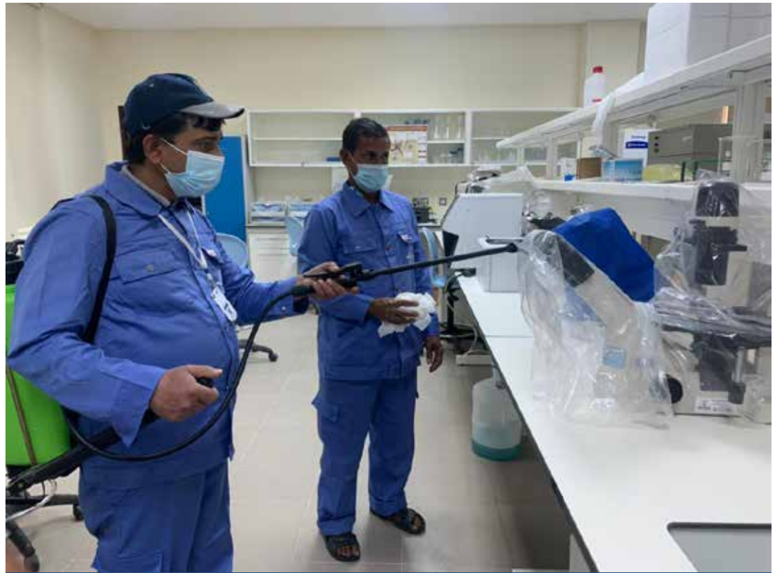
عمليات تعقيم دورية على معامل وقاعات الكليات بالجامعة