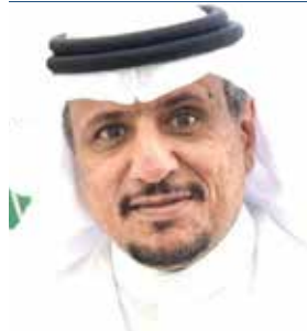
أ.د. منصور بن نايف العتيبي رئيس التحرير وكيل الجامعة للتطوير والجودة